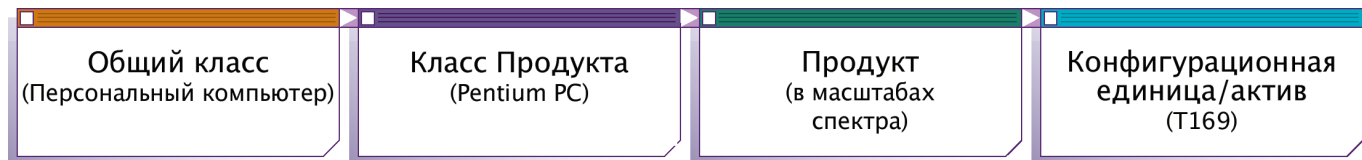
Диаграмма Структуры Продукта assyst

Комплекс предоставляемых нами услуг поможет Вашему бизнесу: